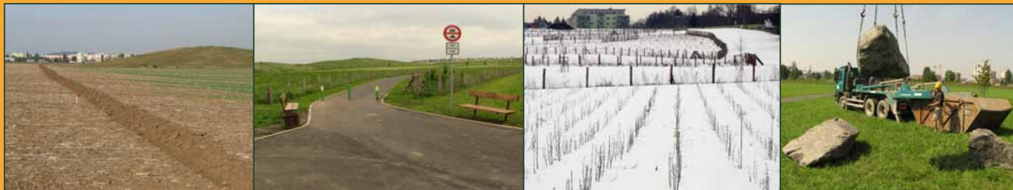
Lesopark Letňany v roce 2008 - vytyčení a oddělení plochy budoucího lesoparku od lánu orné půdy Vstup do lesoparku v roce 2010

Do konce 19. století na území Prahy nebyly nové lesy zakládány, spíše lesy ubývaly a půda byla využívána na pole a pastviny. Mezi lety 1903 a 1914 však bylo v Praze poprvé zalesněno 80 ha a v dalších letech nové lesy přibývaly. Jen mezi