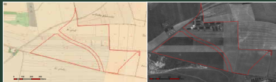
▲ Území lesoparku na mapě stabilního katastru z roku 1848 Území lesoparku v roce 1953 ▲ Červeně je vyznačena hranice současného lesa v majetku hl. m. Prahy.

Původně se na celé ploše lesoparku nacházela pole (viz mapa z roku 1848), po roce 1950 bylo v severní části, pod dnešním umělým kopcem, postaveno 16 provizorních budov, které sloužily jako sklady podniku Rudý Letov (viz mapa z roku 1953). V 80. letech se postupně tyto objekty likvidovaly a v roce 1988 zde již stály jen 3. Od poloviny 90. let až do roku 2002 byla plocha využívána jako deponie výkopových materiálů ze stavby metra. V roce 2002 pozemky získalo hl. m. Praha koupí v dražbě od společnosti Letov a.s. V roce 2007 pak byla zpracována úvodní studie lesoparku, která byla následně dopracována do podoby projektu k územnímu rozhodnutí a následně stavebnímu povolení. Po dokončení výsadby na rovinaté jižní části lesoparku byla v roce 2011 provedena rekultivace severního cípu na ploše okolo bývalé železniční vlečky. Zde bylo mimo jiné odvezeno více než 600 m 3 komunálního odpadu, betonu a jiných materiálů. Na jaře 2012 byla celá zrekultivovaná a ohumusovaná plocha osázena dřevinami. V létě 2011 byla také jižní část lesoparku oživena rozmístěním 2 skupin balvanů. Jeden balvan byl také umístěn na vrchol vyššího kopce, který nabízí zajímavý výhled, jak na letiště Letňany, tak i do Polabí.