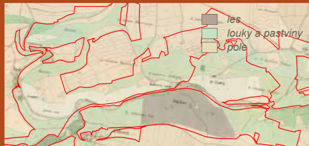
Území lesů v Prokopském údolí na mapě stabilního katastru z roku 1848

Celé území odedávna pokrývala mozaika lesů, skalních výchozů a krasových stepí. S příchodem prvních zemědělců před 5 000 lety lesy ustoupily polím a pastvinám. Ještě před 100 lety bylo údolí téměř bezlesé, což dokládají dobové rytiny. Jediným kouskem lesa, který si podržel přírodní ráz je západní část Dalejského háje. Dalejský háj lze na rozdíl od okolních ploch považovat za lokalitu, která v historii nikdy nebyla zcela odlesněna, a tak se zde zachovaly původní dubohabrové háje.