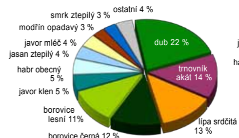
1. Stávající zastoupení dřevin

Věková skladba porostů je jednou z hlavních charakteristik stavu lesa a vypovídá také mnohé o jeho historii. Z grafu č. 4 je patrné zalesňování bývalých opuštěných pastvin na počátku 20. stol. a dosadby ze 70. let 20. stol., kdy došlo k zalesnění okrajových polí (téměř jediné lesy v Prokopském údolí na živných stanovištích). Mimo tyto dvě anomálie je zde rozložení věkových stupňů poměrně vyrovnané (na rozdíl od většiny pražských lesů).