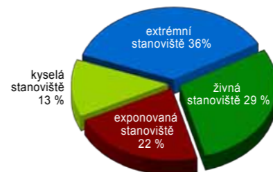
3. Rozložení jednotlivých stanovišť