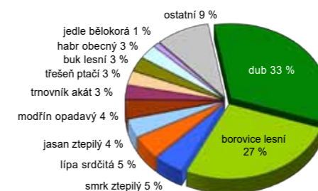
1. Zastoupení dřevin

Věková skladba porostů je jednou z hlavních charakteristik stavu lesa a vypovídá také mnohé o jeho historii. Graf č. 4 např. ukazuje na silně nevyrovnanou věkovou strukturu, kde téměř chybí středně staré porosty a naopak výrazně převažují starší porosty. Tyto starší porosty jsou ovšem v horším zdravotním stavu, takže každoročně zde mnoho stromů usychá. Rovněž vidíme minimálně prováděnou obnovu ve 40. až 80. letech 20. století, která zapříčinila vysoký průměrný věk lesa Kamýk.