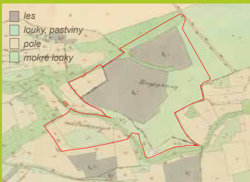
Území lesa Kamýk na mapě stabilního katastru z roku 1840

V rámci lesního hospodaření se v mladších porostech provádí prořezávky, které slouží zejména k odstraňování netvárných a nemocných stromů, a přitom se upravuje dřevinná skladba dle konkrétního stanoviště a ekologických nároků jednotlivých dřevin.