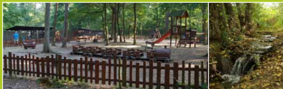
Dětské hřiště u hájovny se zookoutkem