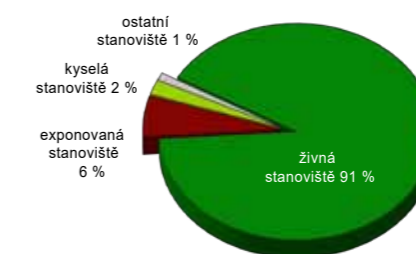
3. Rozložení jednotlivých stanovišť