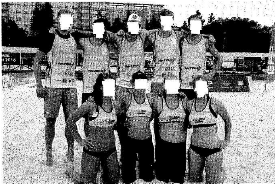
Ilustrační foto: Beachclub Strahov – Vicemistr ČR v beachvolejbale 2017

tisíců Kč, kdyby museli přejíždět do jiných měst v ČR. Beachclub Strahov vždy hrdě reprezentuje příslušnost k místu působení a činnosti - Praze a MČ Praha 6 a činit tak bude i v případě halového MČR juniorů U20 2017.