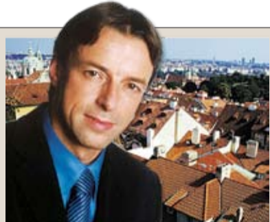
MUDr. PAVEL BÉM primátor hlavního města Prahy