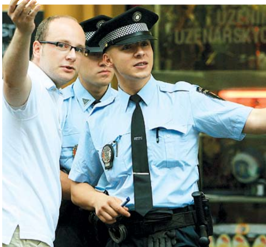
NOVÝ SILNIČNÍ ZÁKON přinesl nové pravomoci pro městskou policii, která je oprávněna měřit i rychlost vozidel.

„Strážníci nyní mohou měřit rychlost vozidel, což v praxi znamená, že se výrazně rozšíří počet míst, kde bude dodržování stanovené rychlosti sledováno. Na území hlavního