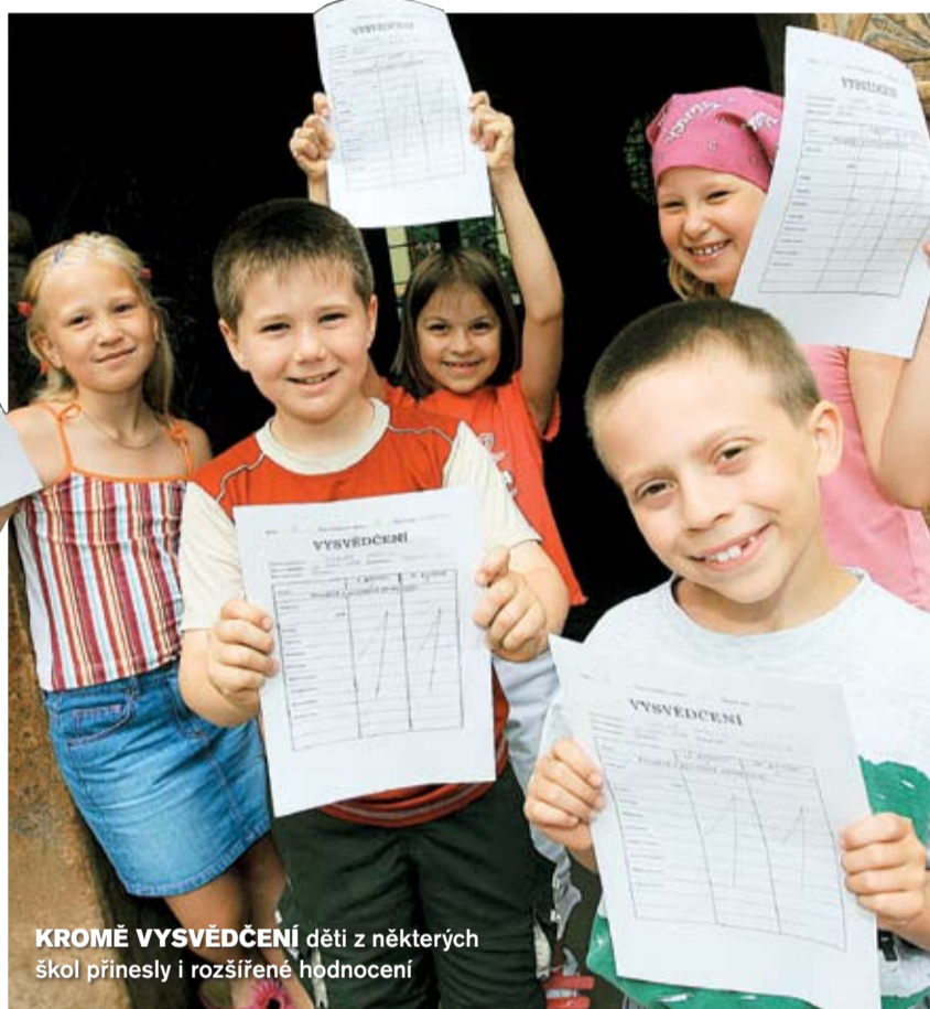
KROMĚ VYSVĚDČENÍ děti z některých škol přinesly i rozšířené hodnocení

At už máte doma premianta, anebo latentního záškoláka, všem dětem nyní nastal čas odpočinku a prázdninových radovánek. Pro mnohé děti to znamená na čas opustit město a věnovat se svým zálibám na venkově, let-