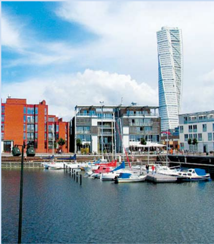
TURNING TORSO – moderní dominanta Malmö.

Pokud si po kulturních zážitcích chcete trochu odpočinout, jsou tu pro vás dva