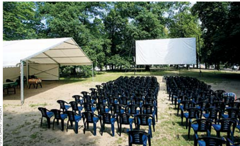
LETNÍ KINO NA STŘELECKÉM OSTROVĚ nabízí tradičně pestrý program.

Již začátkem června byl na Střeleckém ostrově zahájen letní festival Střelák 2006. Až do poloviny září festival nabídne pestrý program filmů, koncertů a divadelních představení. Filmoví diváci se mohou těšit na speciální dramaturgické linie: neděle budou patřit československé a světové klasice, pondělky jsou vyhrazeny pro letošní nabídku ojedinělé přehlídky Projekt 100, úterky pak ovládnou animované filmy nebo snímky s výraznou výtvarnou koncepcí. Středy, pátky a soboty pak doplňuje to nejlepší z distribuční nabídky. Před každou projekcí bude uveden krátký film studentů FAMU nebo VOŠF Zlín. Každý čtvrtek ovládnou ostrov koncerty. Po každém koncertu je nachystána projekce krátkých studentských filmů nebo pásma českých animovaných snímků z archivu Krátkého filmu. Lístky na jednotlivé koncerty lze zakoupit v předprodeji v letním baru na Střeleckém ostrově. Kompletní informace