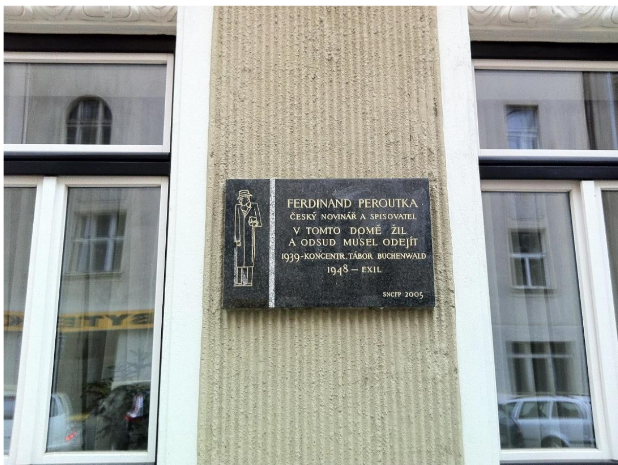
Pamětní deska F. Peroutky na domě v domě v Matoušově ulici 1286 / 5