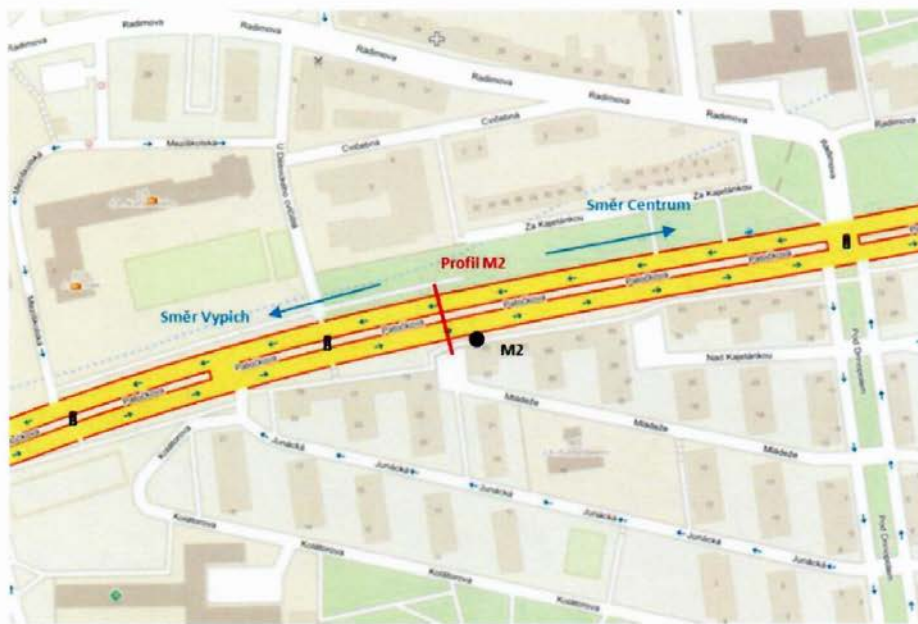
Obr. 1 - Situace umístění profilu č. 2