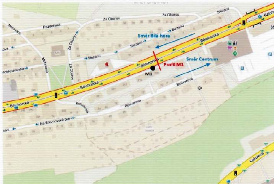
Obr. 1 - Situace umístění profilu č. 1

Níže uvedená místa pokrývají celou trasu komunikace jdoucí od MÚK Malovanka na západ ve směru k D6.