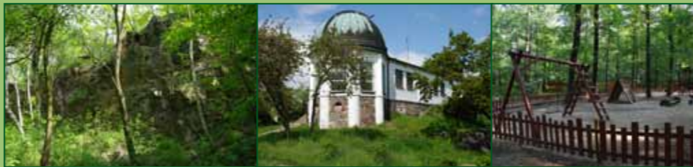
Přírodní památka Ládví