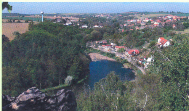
Výhled z Holého vrchu

bu, Suchdol, sedlo Kozích hřbetů a Únětice do severských zemí).