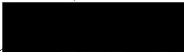
MUDr. Zdeňek Hřib primátor hlavního města Prahy

Toto rozhodnutí nabývá účinnosti dnem 1. března 2021 v 00.00 hodin, ruší rozhodnutí č. 1/2021 ze dne 15. února 2021 pod č. j.: MHMP 198728/2021 a platí do uplynutí trvání nouzového stavu na území České republiky, vyhlášeného Usnesením vlády č. 196 ze dne 26. února 2021.