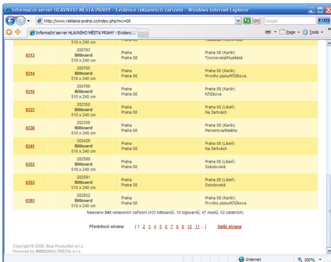
Obr. 4 – Možnost stránkování seznamu

V případě zobrazení více než 25 reklamních zařízení v seznamu je ve spodní části stránky možné měnit aktuálně zobrazenou stránku (obr. 4). Stránku změníte o jednu směrem vpřed, resp. vzad kliknutím na odkazy Další strana , resp. Předchozí strana . Můžete také zobrazit konkrétní stránku kliknutím na její číslo.