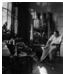
Josef Sudek, Portrét malíře Emila Filly, 1933

FILLA – SUDEK – výstava do 2.1.2005 Výstava dokumentuje přátelství a tvůrčí ovlivňování malíře Emila Filly a fotografa Josefa Sudka.