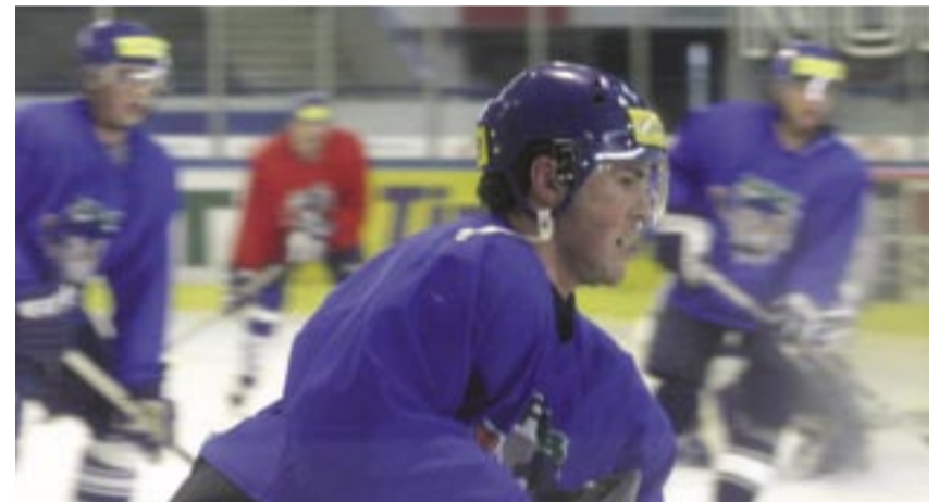
Jaromír Jágr při tréninku s kladenským mužstvem.