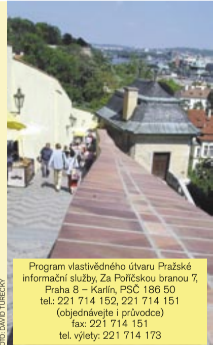
Program vlastivědného útvaru Pražské informační služby, Za Poříčskou branou 7, Praha 8 - Karlín, PSC 186 50 tel.: 221 714 152, 221 714 151 (objednávejte i průvodce) fax: 221 714 151 tel. výlety: 221 714 173

slavných zahraničních osobností, které Prahu navštívily nebo v ní působily. Náhada za zrušenou vycházku dne 18.10.2004. Sraz v 15.00 u pomníku J. Jungmannna na Jungmannově nám. 2.12. /čt/ Zimním Starým Městem - mezi ulicemi Michalskou a Jilskou. Sraz v 15.30 u kašny na Uhelném trhu. 4.12. /so/ Po stopách Franze Kafky na Starém Městě. Sraz ve 14.00 před pamětní deskou F. Kafky na nám. F. Kafky (náměstí za staroměstským kostelem sv. Mikuláše). Státní opera - celková prohlídka. Sraz ve 14.00 před objektem (Praha 2, Wilsonova 4). 5.12. /ne/ Výlet - „Mikuláš ztratil plášť...“. Kourim, Přerov nad Labem, Ostrá u Lysé nad Labem. Z Židovských pecí na Parukářku. Sraz ve 14.00 na stanici tram. č. 1, 9, 16 „Chmelnice“. Kostel sv. Václava na Zderaze. Sraz ve 14.00 před objektem (Resslova ul.). Vyšehrad. Celková prohlídka včetně kasemat. Sraz ve 14.00 před kostelem sv. Petra a Pavla. Vycházky se konají, sejde-li se nejméně deset účastníků. Vstupné do objektu si hradí účastníci sami. Studující mládež a důchodcům poskytujeme slevu, není-li uvedeno jinak. Maximální kapacita velkého sálu PIS - do 50 osob, malého sálu PIS - do 20 osob.