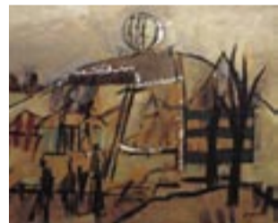
František Gross, Libeňský plynojem, 1939

ČESKÉ UMĚNÍ 20. STOLETÍ – stálá expozice Tematická expozice představuje řadu ojedinělých souborů z let 1900-1990 ze sbírky Galerie hl. města Prahy (díla Toyen, J. Símy, J. Zrzavého, J. Koláře, K. Nepraše, J. Sopka, J. Róny, aj.) LIBEŇSKÝ PLYNOJEM – výstava do 2.1.2005 Unikátní objekt pražské industriální architektury v díle známých výtvarníků, fotografů a literátů.