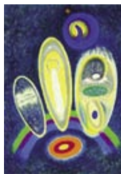
Planoucí místo, 1985