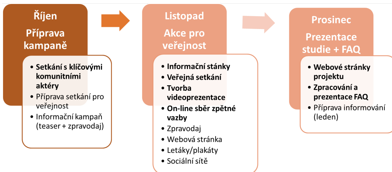
obrázek 3 - časové schéma konzultačních a informačních aktivit

Zapojení cílových skupin do sběru zpětné vazby probíhalo prostřednictvím několika typů aktivit jak ve fyzickém prostoru, tak on-line.