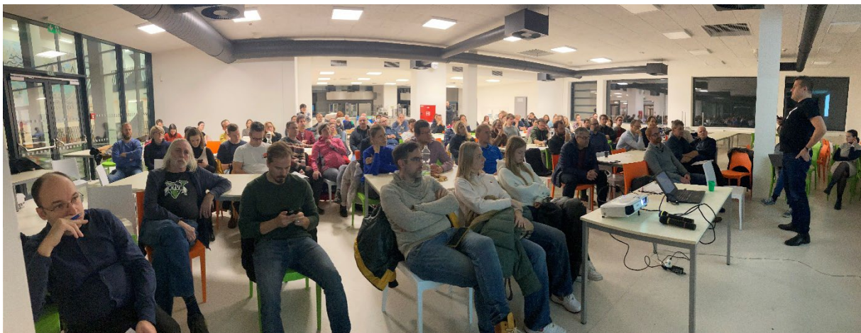
obrázek 5 – úvodní prezentace studie předcházející plenární diskuzi (veřejné setkání, ZŠ Elektra, 14. 11. 2024)