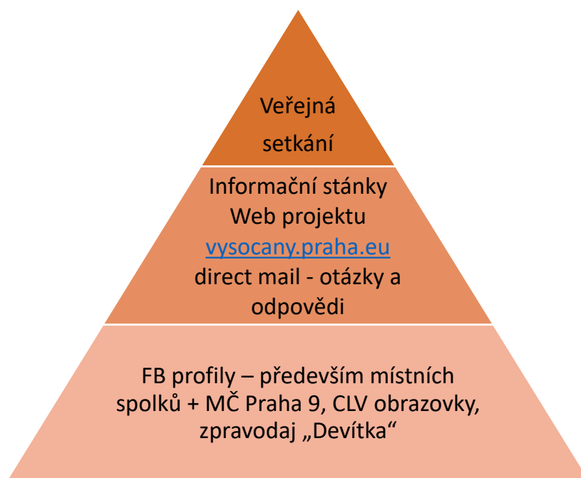
obrázek 7 schematické znázornění dopadů informační kampaně na budování informovaného názoru