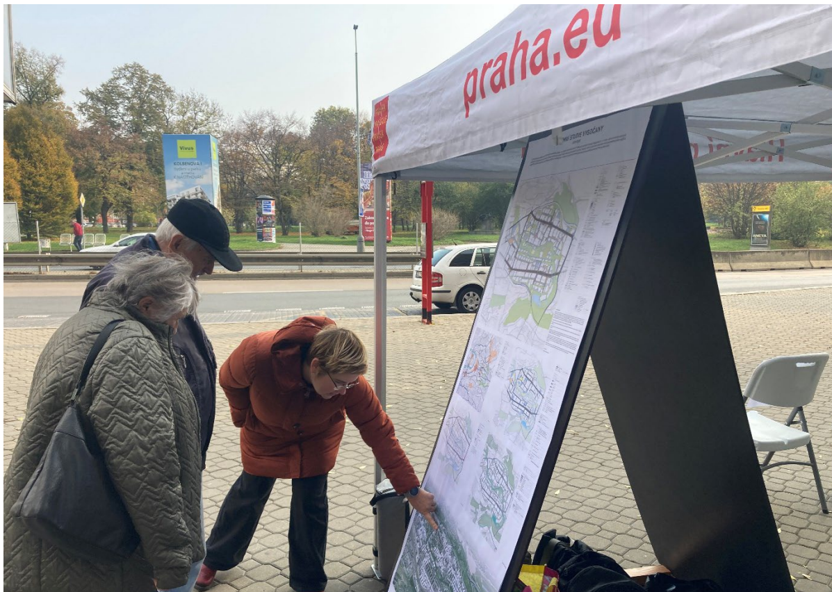
obrázek 6 - prezentace studie na stánku (stanice metra Vysočanská, 8. 11. 2024)

veřejném prostoru měl též za cíl upozornit na veřejná setkání (viz výše) a na možnost seznámit se se studií v záznamu prezentace.