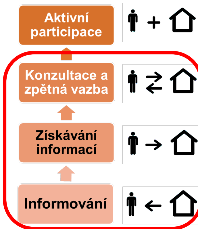
Obrázek 2 - úrovně ve kterých probíhala participace (dle Agora, 2010)

V rámci informační kampaně jsme nejen informovali o tvorbě studie, ale realizovali též řadu aktivit, které měly přispět k jejímu porozumění. Naším cílem bylo, aby se občané dozvěděli, jak mají studii číst, jak jí rozumět a jak bude studie následně využívána. To nám umožnilo získat kvalifikovanější zpětnou vazbu a zároveň tím obyvatelům usnadnit případné připomínkování studie ve veřejném projednání.